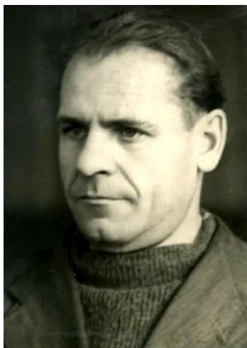
А.К. Кротов.

20 марта исполняется 110 лет со дня рождения ивановского художника Александра Кирилловича Кротова (1913 – 1993) – многогранного мастера, автора пейзажей, марин, портретов, натюрмортов и жанровых картин.