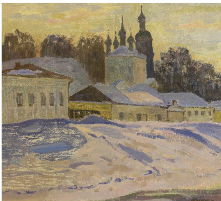
А.К. Кротов. Вечерний Плес. 1974 г. Картон, масло. Плесский музей-заповедник

В собрании Плесского музея-заповедника представлены зимние пейзажи Кротова: «Вечерний Плес» (1974), «Зимой в Плесе» (1975), «Плес. Вечер» (1982). Александр Кириллович был увлечен красотой этого сезона, когда природа отдыхает, набирается сил под пушистым белым покровом. А зимний Плес – это настоящая сказка, и художник стремился отыскать здесь свои, неизведанные места и сюжеты. «Зимой в Плесе» (1975) погружает зрителей в уютную атмосферу провинциального русского городка, с его бревенчатыми домиками и храмом, будто спрятанными в лесной глуши.