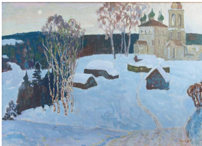
А.К. Кротов. Плес. Вечер.1982 г. Картон, масло. Плесский музей-заповедник

талантливым колористом, Александр Кириллович умел находить гармоничное композиционное строение, замечательно передавал фактуру снега и инея, умело подбирал палитру. Его пейзажи, посвященные зимней природе Плеса очень живые и атмосферные.