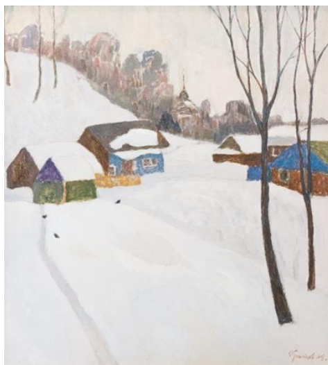
А.К. Кротов. Зимой в Плесе. 1975 г. Картон, масло. Плесский музей-заповедник.

В собрании Плесского музея-заповедника представлены зимние пейзажи Кротова: «Вечерний Плес» (1974), «Зимой в Плесе» (1975), «Плес. Вечер» (1982). Александр Кириллович был увлечен красотой этого сезона, когда природа отдыхает, набирается сил под пушистым белым покровом. А зимний Плес – это настоящая сказка, и художник стремился отыскать здесь свои, неизведанные места и сюжеты. «Зимой в Плесе» (1975) погружает зрителей в уютную атмосферу провинциального русского городка, с его бревенчатыми домиками и храмом, будто спрятанными в лесной глуши.